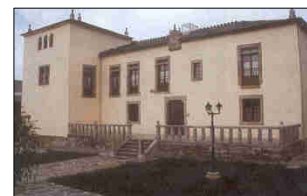
Torre do Barrio