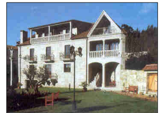
Antiga Casa do Monte

Un efecto que revela o carácter de manifestación da sociedade do espectáculo que adquiriu o turismo, vézmo-lo na conversión de certas cidades en museo e da poboación en figurantes. A organización de festas típicas , as mostras de artesanatos folclorizantes (o muiñeiro que muiña para recreo dos visitantes), son elocuentes probas do que dicimos. Aparece entón a aculturación . O etnocentrismo, amparado por campañas publicitarias, converte minorías culturais (comunidades cun perfil étnico diferente) en produtos exóticos, os suxeitos en obxectos de consumo e a súa cultura en atracción turística. 14 Tamén os investimentos millonarios que se fan nas grandes cidades (proxectos arquitectónico-museísticos, exposicións, etc) revisten ese carácter de