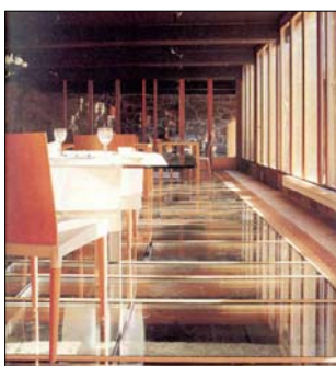
Casa de Aldán