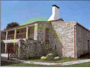
Cabeza de Boi