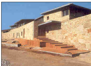
Casa de Aldán